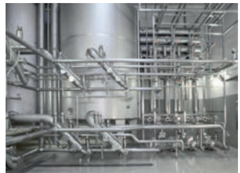
CIP Anlage für Sirupraum

Die KIESELMANN K-Vesselmix Düse ist aus massivem Vollmaterial gefertigt und e-poliert. Sie ist einteilig und komplett wartungsfrei. Zur Reinigung wird die Düse einfach in den CIP-Kreislauf des Tanks eingebunden. So erfüllt sie höchste Ansprüche an die Hygiene.