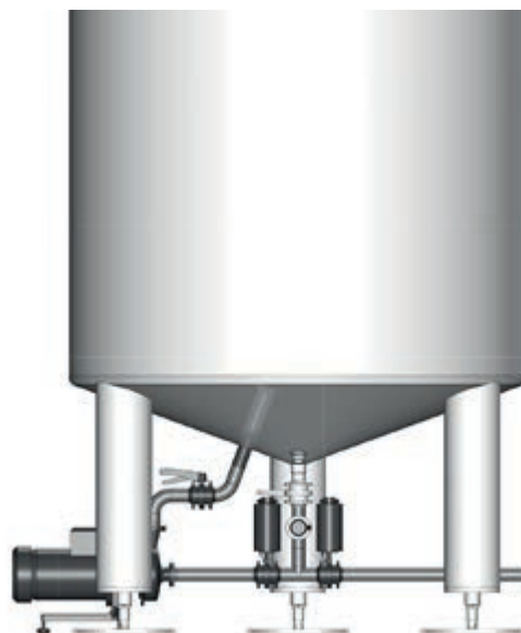
Das K-Vesselmix System, mit wenigen Komponenten zum perfekten Mischer.