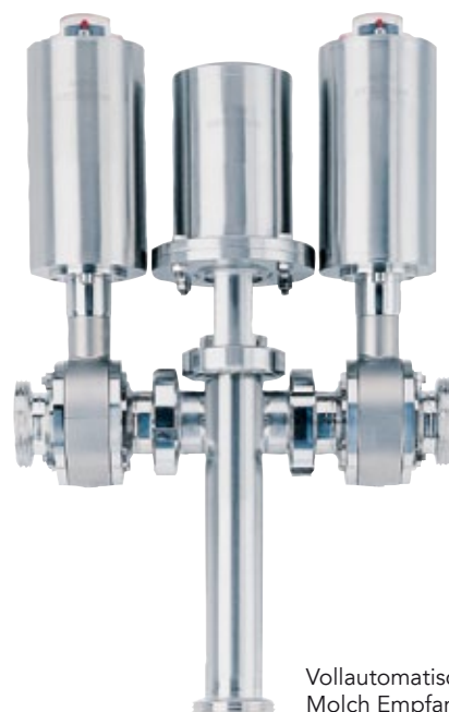
Vollautomatische Molch Empfangsstation