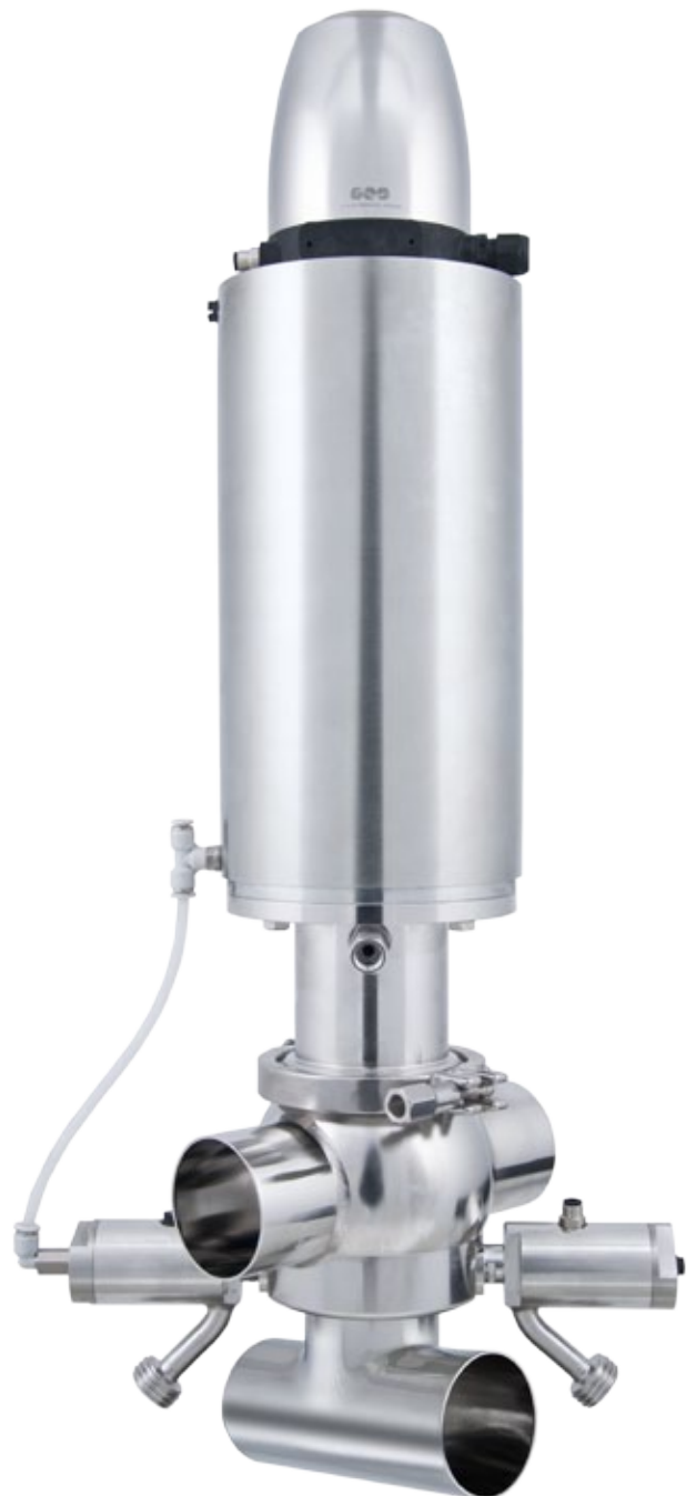
Molchbares doppeldichtendes Einsitzventil