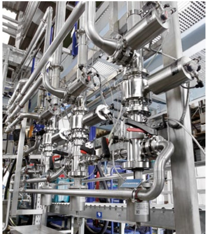
KIESELMANN Molchanlage in einer Produktion

Sparen Sie kurzfristig und nachweisbar Zeit und Geld, indem Sie die KIESELMANN Molchtechnik in Ihre Produktion integrieren. Diese Technologie gewährleistet eine nahezu verlustfreie Entleerung der Rohrleitungen. Sie reduzieren die Kosten in den Bereichen Reinigung, Abwasser, Energie und vor allem erfolgt dadurch eine effizientere Nutzung der Rohstoffe.