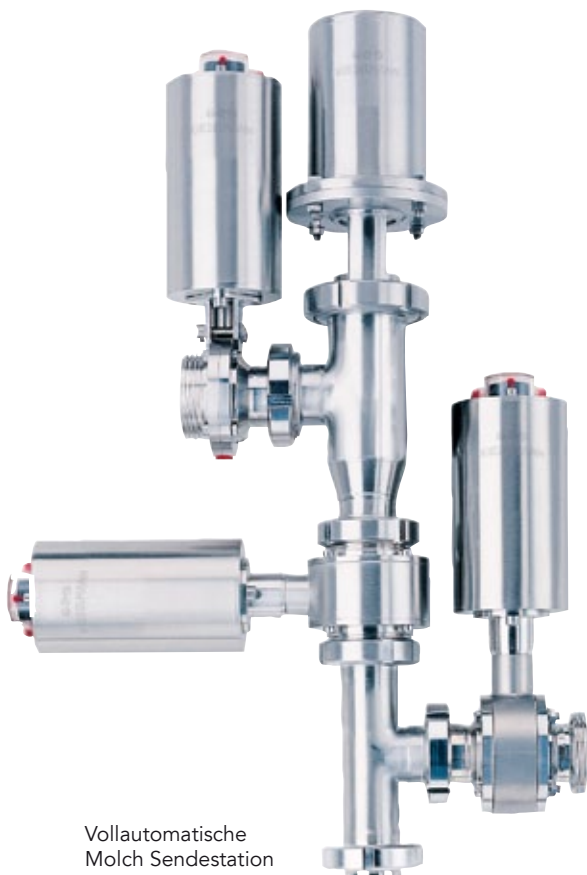
Vollautomatische Molch Sendestation

Beträchtliche Reduzierung des Verkabelungsaufwandes, Minimierung der Installationszeiten, Vereinfachung der Inbetriebnahme, umfangreiche und unkomplizierte Fehlerdiagnosemöglichkeiten, vor allem aber höhere Anlagensicherheit und bis zu 30% weniger Kosten für die Steuerungen lassen sich mit dieser Automatisierungstechnik von KIESELMANN problemlos realisieren.