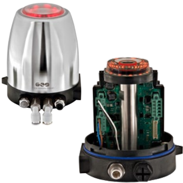
KIESELMANN KI-TOP Steuerkopf mit SPS oder ASI-Bus Steuerung